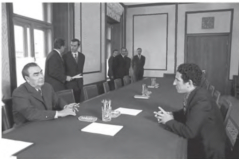
جانب من لقاء بين الأمين العام للحزب الشيوعي السوفياتي ليونيد بريجنيف ورئيس الوزراء الليبي عبد السلام جلود أثناء زيارته للاتحاد السوفياتي قبل بداية المحادثات الثنائية، 1974 / 5 / 16.